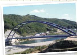
宮崎県内唯一の橋梁メーカーとして、ライフラインを司る橋を架け続けます

鉄や鋼などを加工する高い技術をもち、食品を加工する機械、橋を造る鉄骨、大型船、発電所など、いろんな場所で私たちの製品や技術が活躍しています。また、納入した機械のメンテナンスをする仕事もしています。九州を中心に関東方面まで工場や事業所、営業所等があり、韓国、中国、ミャンマーなど海外での取引も行っています。