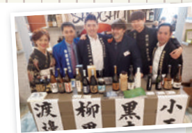
現在、泡盛を含む9蔵を、イタリアを中心に展開しています

宮崎を拠点として、女性ならではの視点で商品開発やイベント企画などを行っている同社。もともとは食品が中心でしたが、現在は高知県や佐賀県の武雄市などの地方自治体から、病院、雑貨店まであらゆるジャンルのコンサルを行っています。また、「宮崎市移住センター」の運営も行っていて、宮崎市に移住を検討される方の仕事や住まいなどの相談を受けています。