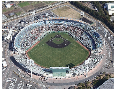
KIRISHIMAサンマリナススタジアム宮崎