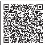
宮崎観光情報旬ナビ サイト